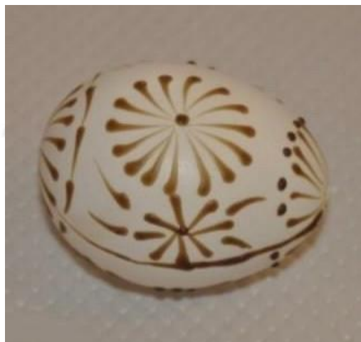
Зразки лемківських писанок [5, с. 78]